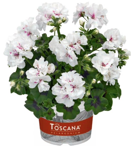
SUNFLAIR WHITE (EVA)

früh, halbgefüllt early, semi-double précoce, demi-double