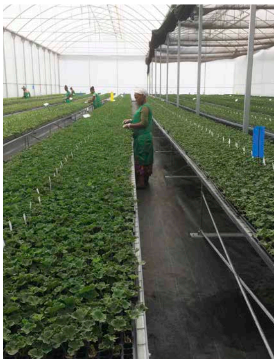
New Motherstock location in Abyssinia, Ethiopia.

sehr früh, halbgefüllt very early, semi-double très précoce, demi-double