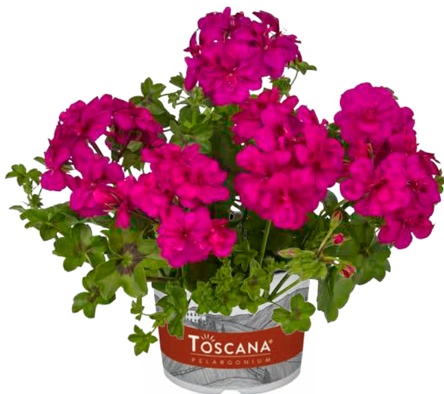
BIG5 NEON PINK (INDIA)