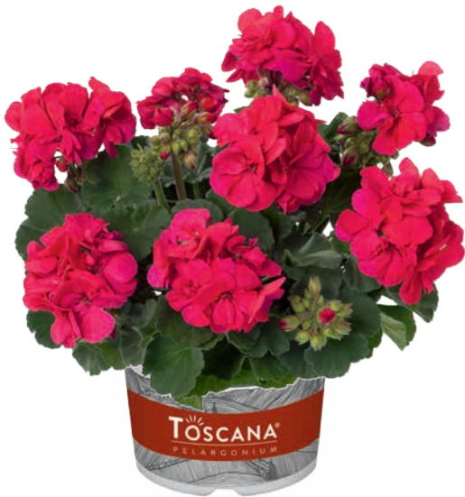
CASTELLO NEON PURPLE (ONNO) (D) (C) (M)