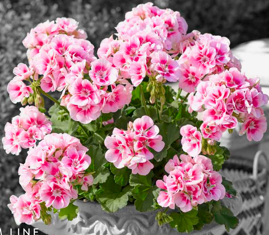
SMART PINK EYE (LIEKE)