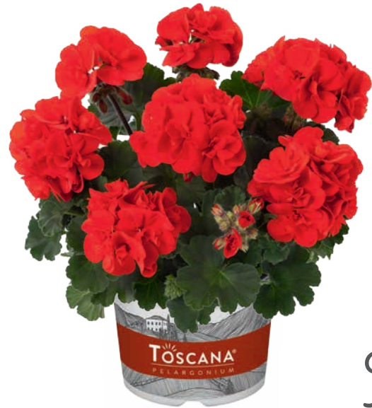
CASTELLO RED (RONJA) (D) (C)

früh, halbgefüllt early, semi-double précoce, demi-double