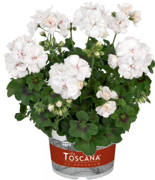
PRIMO WHITE (LONA) (G) (C)

eindeutig zweifarbig bicoloured flower fleur bicolore