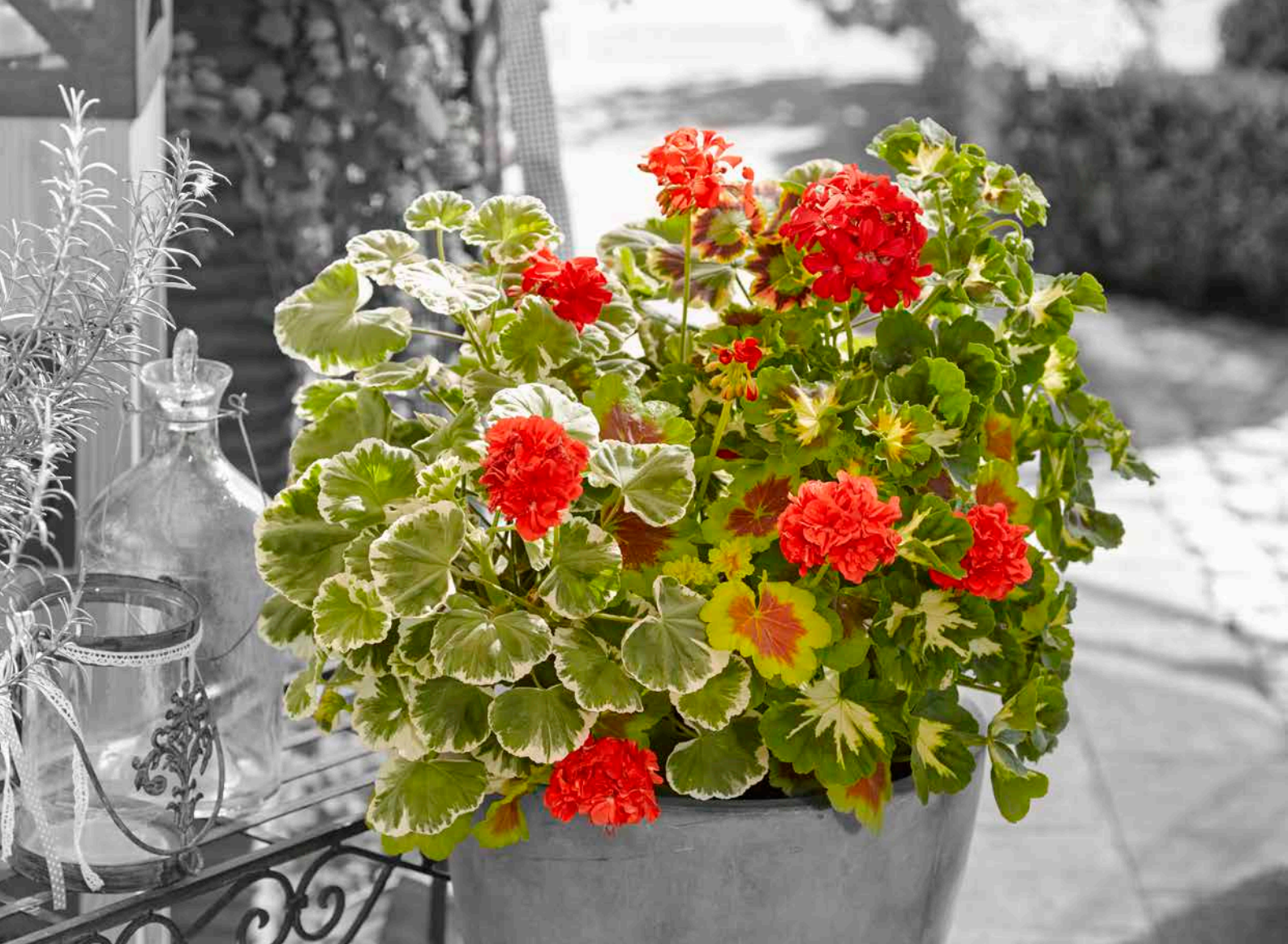
SPECIALS HAPPYTHOUGHT RED, MADAME SALLERON, MRS. POLLOCK