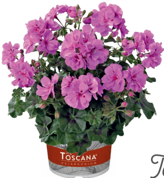
PRIMO AMETHYST (MARLEN)

sehr frühe Blüte, frisches grünes Laub very early flowering, fresh green foliage fleurie vite, feuillage frais vert