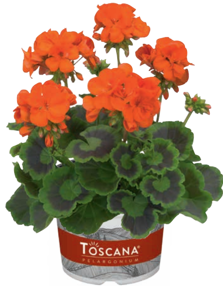
SMART ORANGE (TREND ORANGE)

frühe Blüte, sehr runder Aufbau early flowering, very round plant habit floraison précoce, port en boule