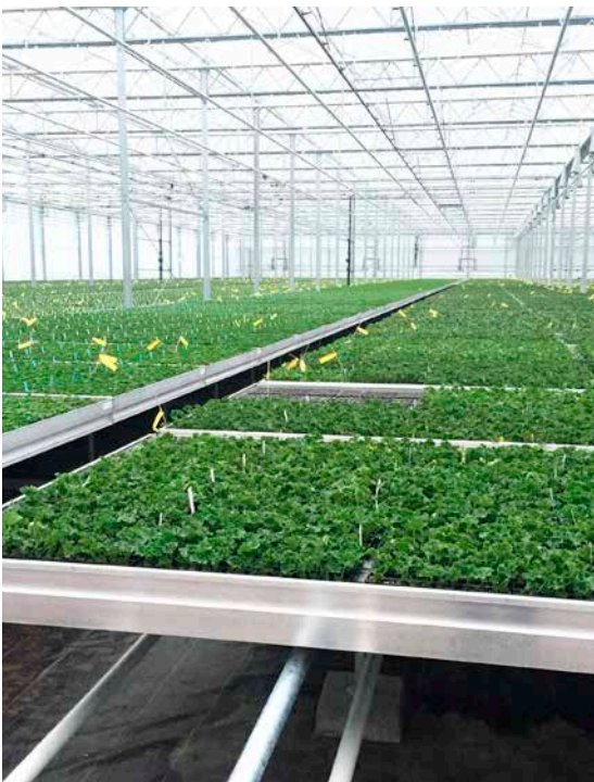
New Toscana rooting station facility.

zweifarbig, guter, runder Aufbau bicolour, good round plant habit fleurs bicolores, bien régulier