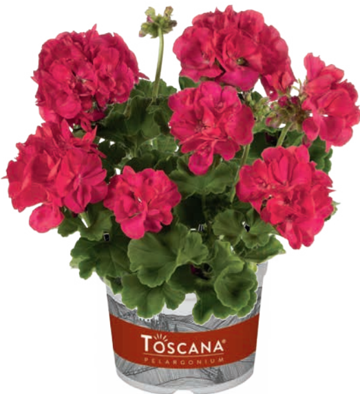
SMART PURPLE RED (FRAUKE)

sehr früh, halbgefüllt very early, semi-double très précoce, demi-double