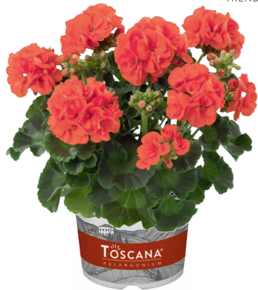
TREND ORANGE (AURORA)

auffallende rote, bewährte Top-Sorte striking red, proven top variety rouge éclatant, variété supérieure