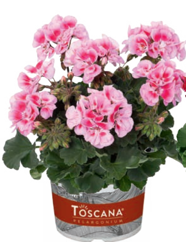
DOLCE VITA PINK EYE (LINUS)