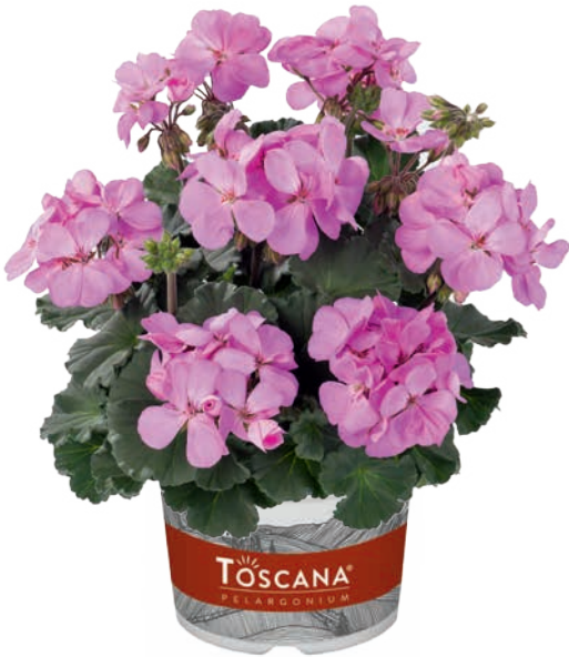
DOLCE VITA LAVENDER (LARA)