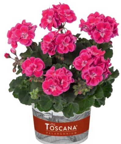
CASTELLO ROSE EYE (TAMMO)