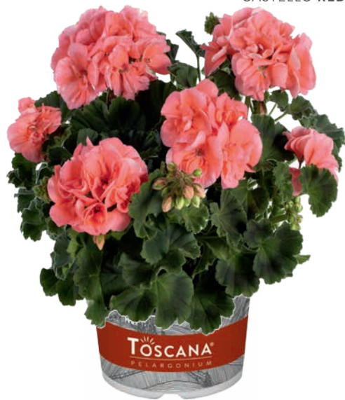
CASTELLO SALMON (SÖREN)

sehr runder Aufbau very round plant habit bien ramifiée