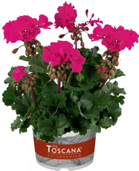
DOLCE VITA NEON BLUE (BELMONTE NEON BLUE) (D) (M)

intensives Neonblau intensive neon blue bleu néon intense