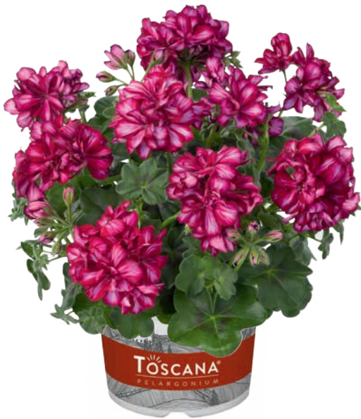
PRIMO LOLLIPOP BURGUNDY (MAXIMA) (G) (C) (M)

burgunderrot mit weißen Streifen dark red white bourgogne blanc