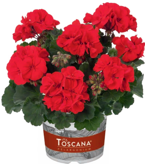
DOLCE VITA SCARLET RED (NIKLAS) (D) (M)