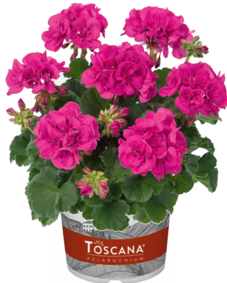
SMART LILAC (KATARINA)

starkes Laub, besondere Blütenfarbe strong foliage, special flower colour feuillage fort, couleur de la fleur spéciale