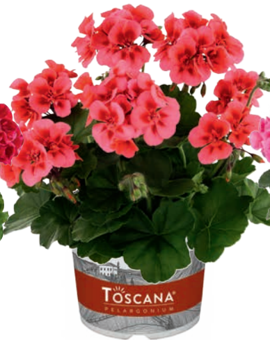
DOLCE VITA CORAL EYE (HOT SPOT CORAL)