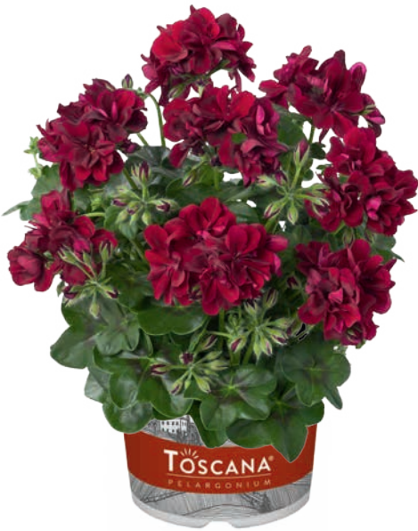
PRIMO BURGUNDY (TOMKE)