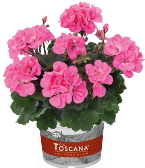
DOLCE VITA PINK (ANNE)

attraktive Blütenfarbe mit kontrastierendem Laub good flower colour with contrasting foliage fleur/feuillage spéciale