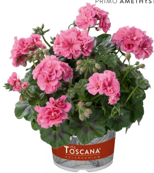
PRIMO PINK (ERKE)

spezielle, dunkle Blume special dark flower couleur noir spéciale