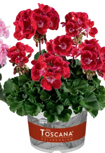
DOLCE VITA RED EYE (HOT SPOT KISS)