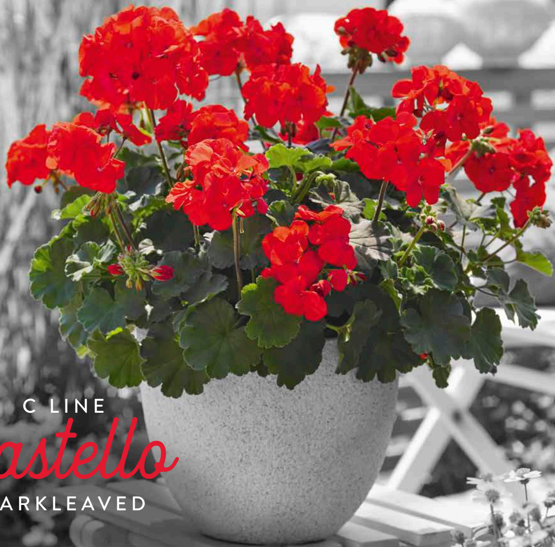
CASTELLO RED (RONJA)