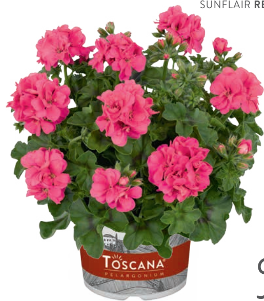
SUNFLAIR PINK (LINDA)

große, runde Blüten, Mutation aus Ruben big round flowers, mutated from Ruben belle fleur ronde, amélioration de Ruben