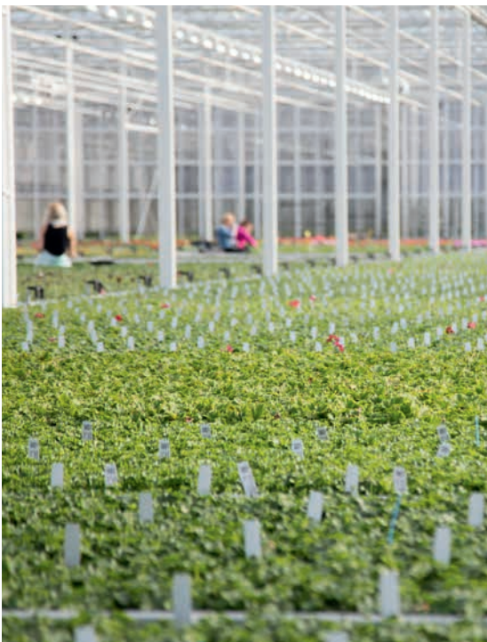
New Toscana rooting location in Europe.

frühe Blüte, runde Wuchsform mit dunklem Laub early flowering, round plant habit with dark foliage précoce, plante ronde