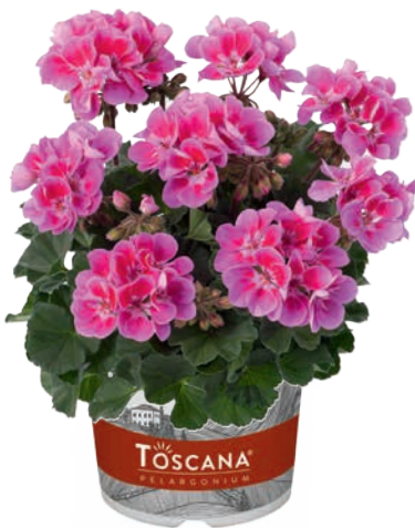
CASTELLO LAVENDER EYE (RAIKO)