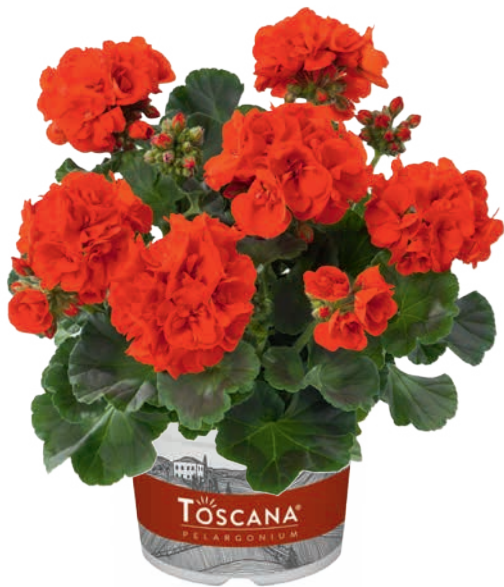
TREND RED (LISKE)