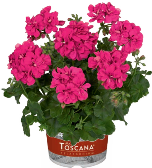
MEDIO HOT PINK (RITA)