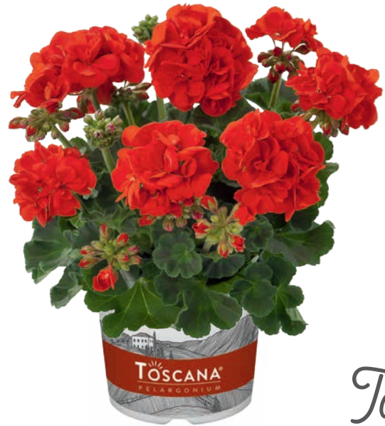
ECO SCARLET (FRIESIA)

sehr früh, halbgefüllt very early, semi-double très précoce, demi-double