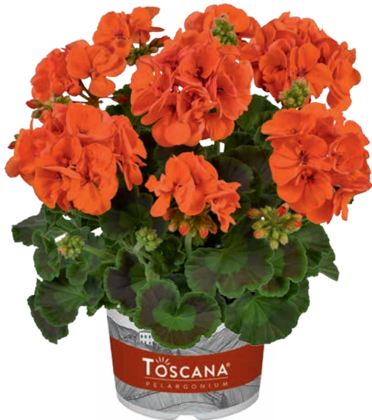
ECO ORANGE (SALLY)