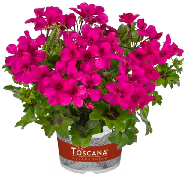
RAINBOW NEON PURPLE (NEON)