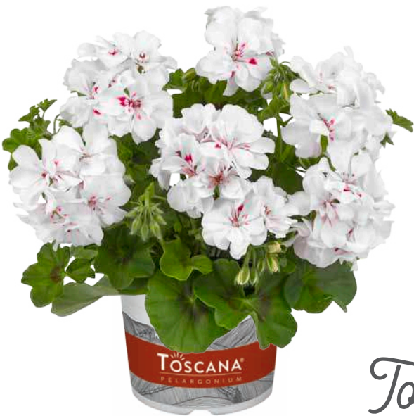
BIG5 WHITE (WHITE ANGEL)

sehr früh, halbgefüllt very early, semi-double très précoce, demi-double