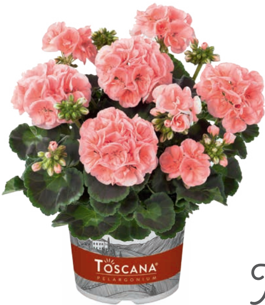
SMART SALMON (LENJA)

helles Lachsrosa mit weißem Rand light salmon, white edge saumon, bordé tendre