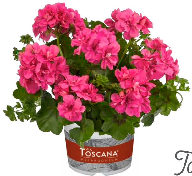
MEDIO PINK (SUNFLAIR ANA)

gute Verzweigung good branching habit bien ramifiée