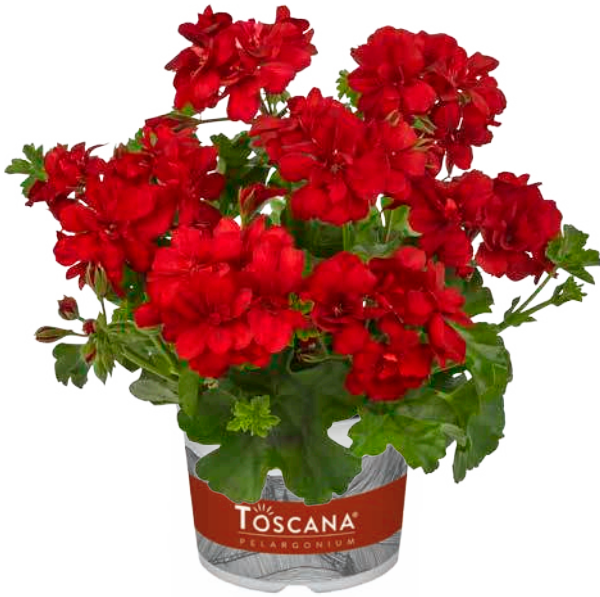
BIG5 RED (RED DEVIL)