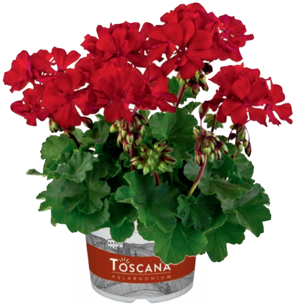
CASTELLO DARK RED (BELMONTE NIGHT) (D) (C)