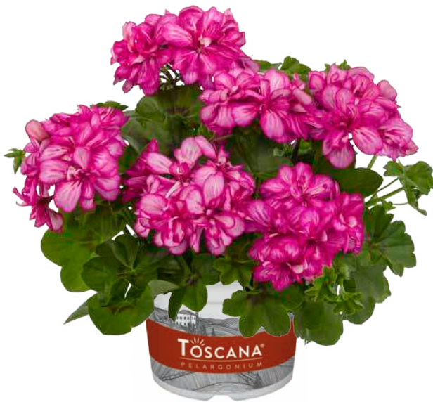
SUNFLAIR LOLLIPOP CANDY