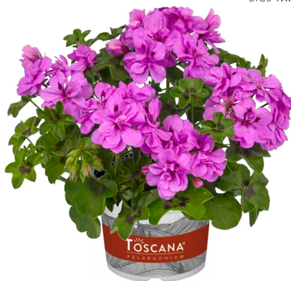
BIG5 AMETHYST (MALVA)

sehr früh, halbgefüllt very early, semi-double très précoce, demi-double