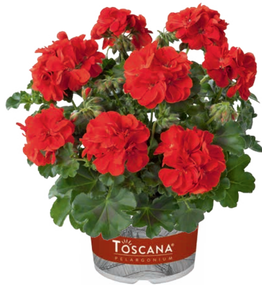
PRIMO SCARLET (FALCO)

frühe Blüte, dunkellaubig early flowering, dark leaved floraison hâtive, feuillage foncé