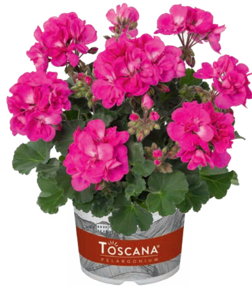
DOLCE VITA LILAC BLUE (KLAAS) (D) (M)

sehr früh, halbgefüllt, dunkellaubig very early, semi-double, darkleaved très précoce, demi-double, feuillage foncé