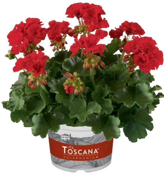
ECO RED (SMART DARK RED)