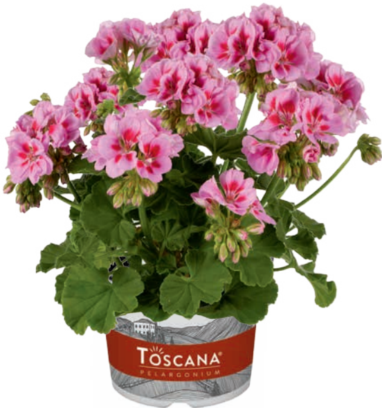
TREND LAVENDER PINK EYE (VERA)

früh, halbgefüllt early, semi-double précoce, demi-double