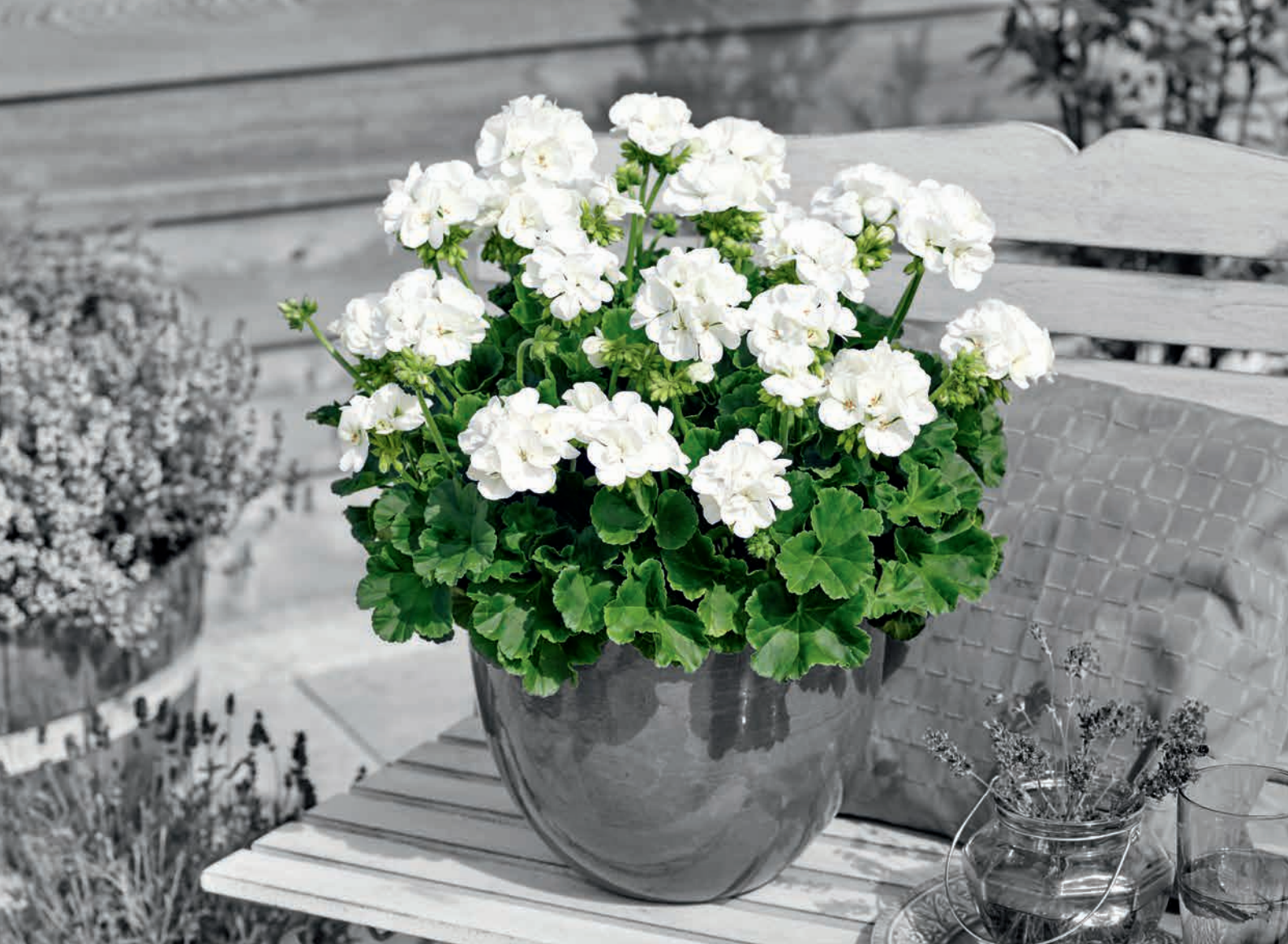
SMART WHITE (LASSE)