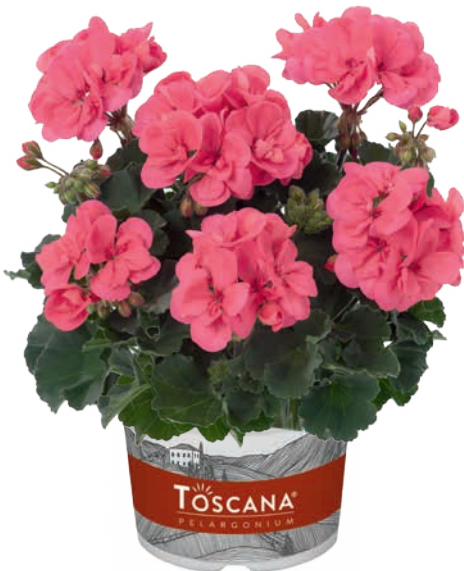
DOLCE VITA HOT CORAL (LISA)

dunkellaubig, Top-Sorte dark leaved red, top variety rouge à feuilles foncées, variété haute