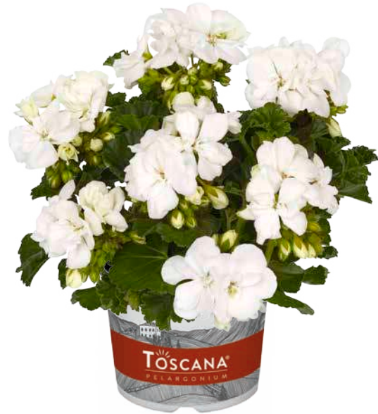
DOLCE VITA WHITE (ERIKA)

sehr gute, große Blüte, bemerkenswerte Zweifarbigkeit very good large flower, remarkable bicolour grande fleur, variété remarquable bicolore