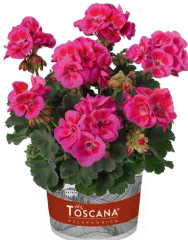
CASTELLO LILAC EYE (BALDO)