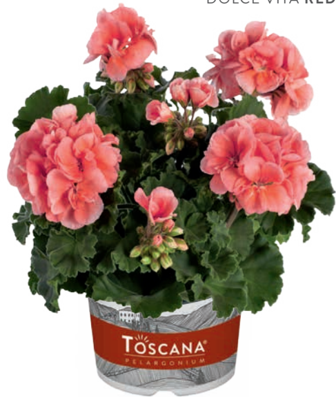
DOLCE VITA SALMON (EMMA) (D) (M)

dunkellaubig, Top-Sorte dark leaved red, top variety rouge à feuilles foncées, variété haute