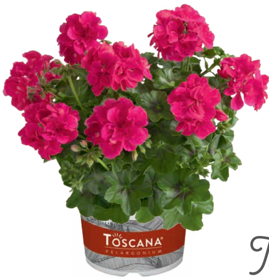
SUNFLAIR HOT PINK (JOSINA)