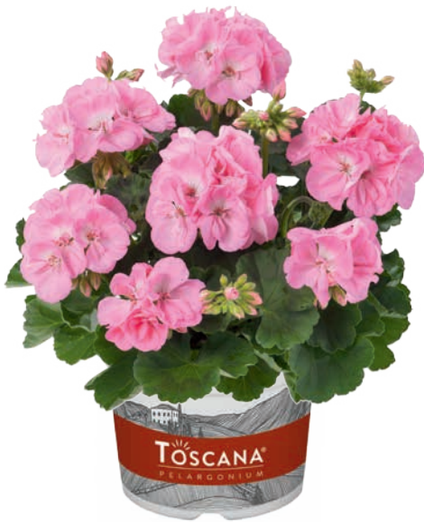
TREND LIGHT PINK (GESA)