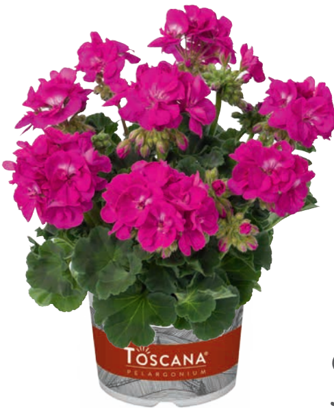
ECO PURPLE (MERLE)