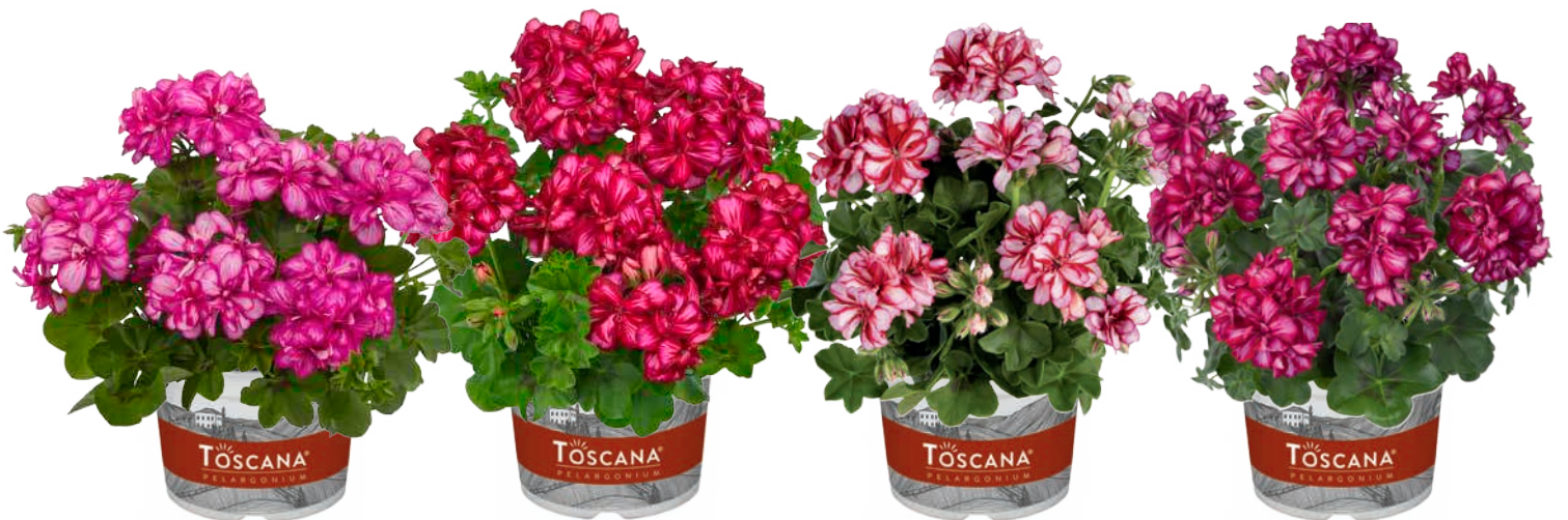
SUNFLAIR LOLLIPOP CANDY