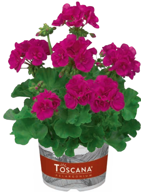
TREND NEON BLUE

helle Zonierung light zoned foliage feuillage clair zoné