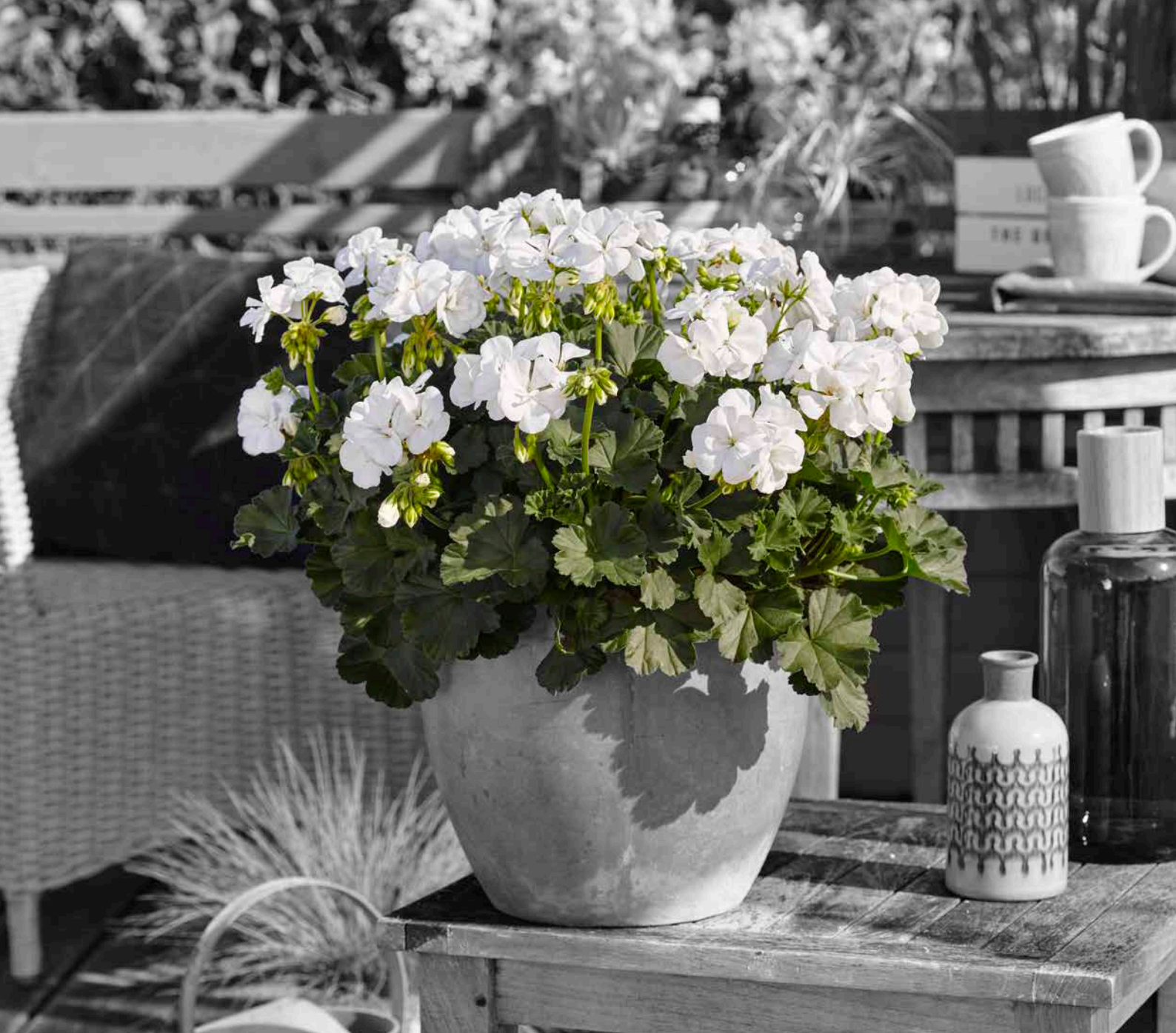
CASTELLO WHITE (ISABELLA)