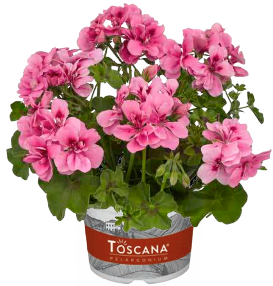
BIG5 LIGHT PINK (SOFT ROSE)

sehr früh, halbgefüllt very early, semi-double très précoce, demi-double