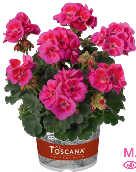
CASTELLO LILAC EYE (BALDO) (D) (C)

frühe Blüte, helle Blütenfarbe mit einem guten Wuchs early flowering, bright flower colour with a good plant habit floraison hâtive, couleur spéciale, bien ramifiée