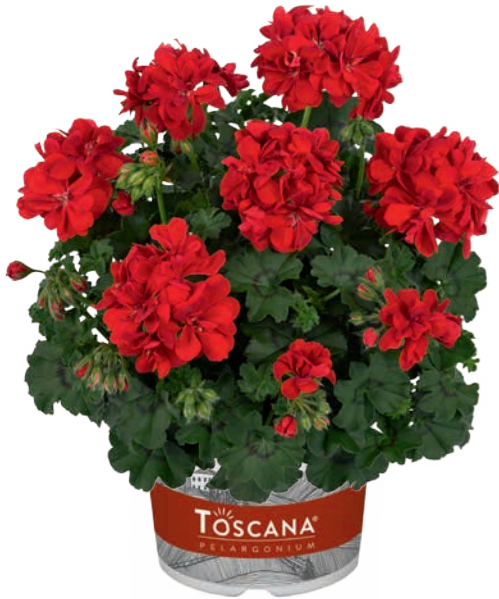
PRIMO RED (ALEXANDRA)